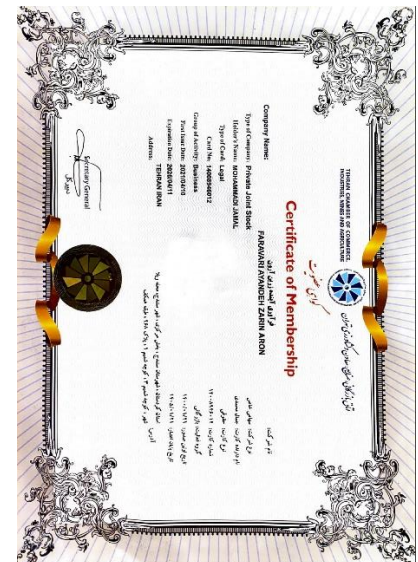
گواهی عضویت در اتاق بازرگانی