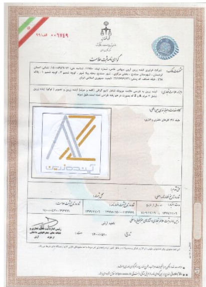
گواهی ثبت برند با نام آینده زرین